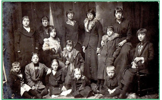
Belgische vluchtelingen in Culemborg 1914 die werden opgevangen in De Werkman en in de Nieuwe Bak

Tekst: Peter Schipper