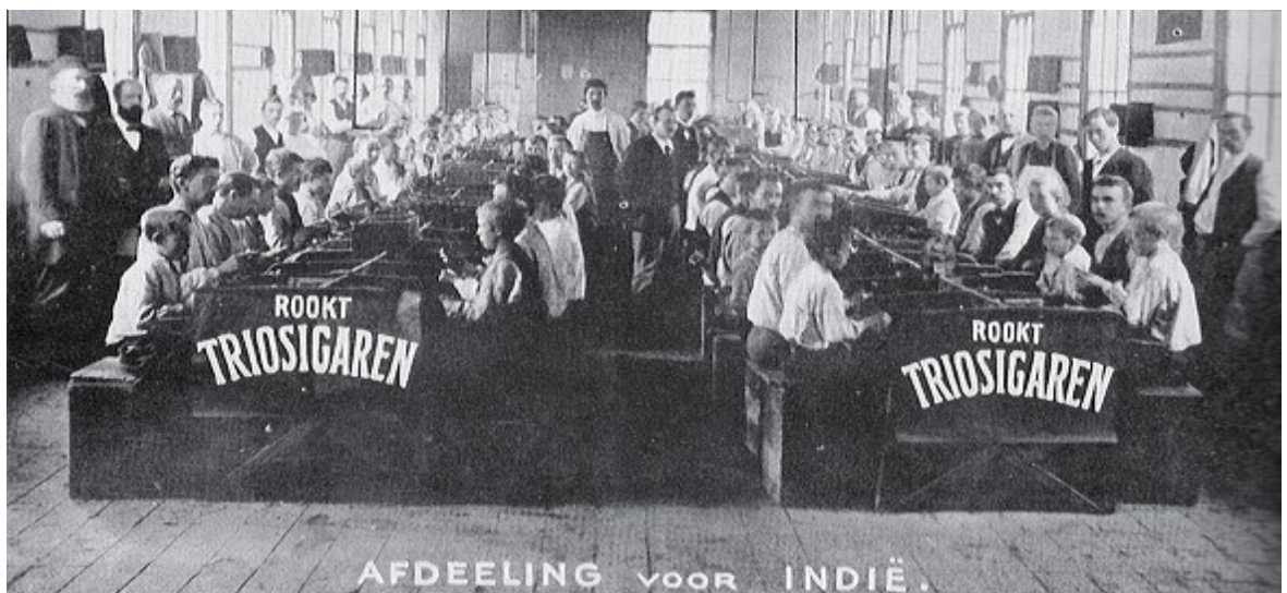
Sigarenfabriek De Trio

Bron: Ad Eillebrecht, Jet Grimbergen, Peter Schipper, De sigarennijverheid in Culemborg , uitg. G.J.L. Koolhof, Culemborg 1986.