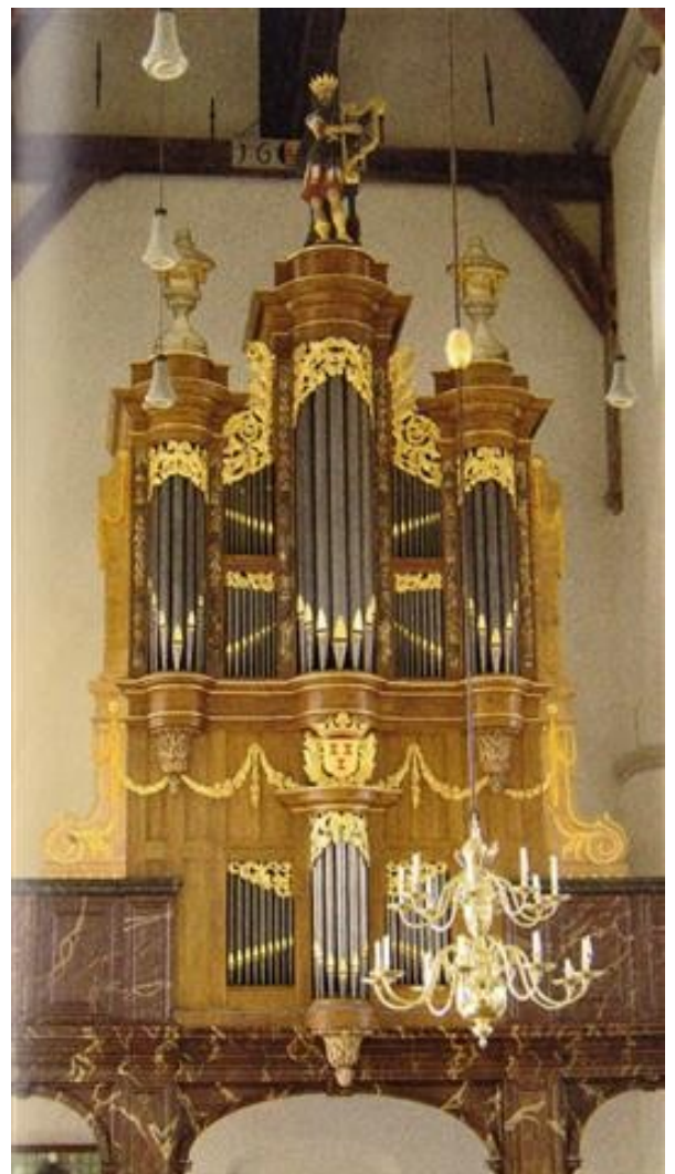
Het hoofdorgel van de Barbarakerk uit 1719.

'Ja, door alles wat we sinds 1970 op muziekgebied hebben gedaan, is de Barbarakerk landelijk