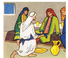
5. Daarna deed Hij water in het bekken en begon de voeten der discipelen te wassen. Joh. 13 : 2

Waar werd de zondagsschool gehouden? In de Scheffelschool in de Ridderstraat, in de 'oude HBS' in het Elisabeth Weeshuis, nog even in een school aan de Markt en later in de barakken van het KWC. Altijd een punt dat goed bereikbaar was voor kinderen uit beide kerken (hervormd en gereformeerd), want de zondagsschool was een zelfstandige onderneming met ook Molukse kinderen. Daar is